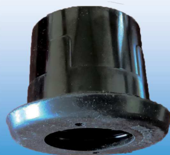
連結式ハウスソケット ソケット保護部・ゴムパッキン